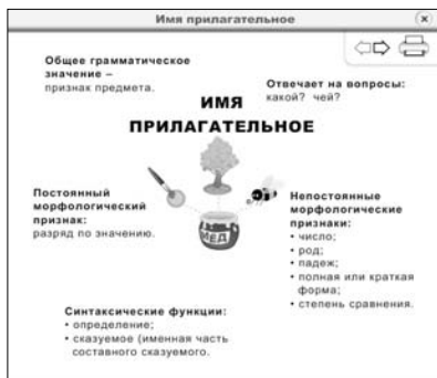
Конспект № 1