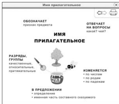
Конспект № 2

На основе конспектов можно предложить различные задания учащимся: анализ его содержания, составление связного рассказа о части речи, формулирование определений грамматических категорий, характеризующих определенную часть речи, наполнение конспектов примерами и многое другое.